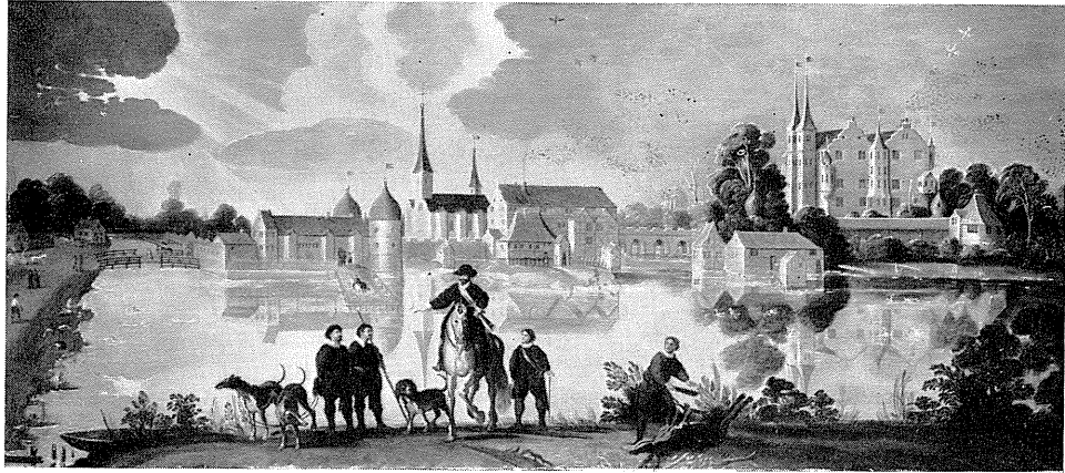
Frederik den Andens Frederiksborg, som opførtes under Herluf Trolles ledelse. (Frederiksborg). Længst til venstre i husrækken ses det høje tag af den bygning, hvori kongens latinskole holdt til, og som endnu kaldes „Herluf Trolles Tårn“.